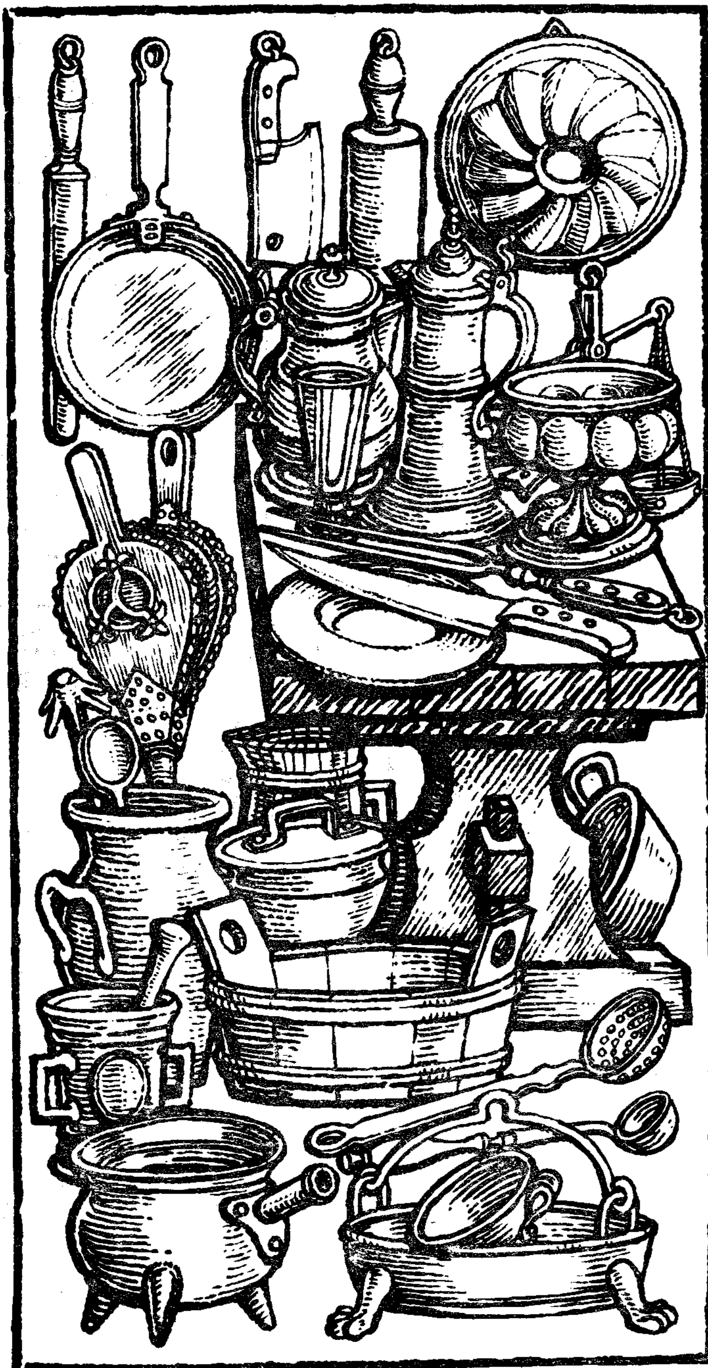
Bavor Rodovský z Hustiřan, Kuchařství (frontispice)

Z KNIH, KTERÉ UPRAVIL, ILUSTROVAL NEBO VYZDOBIL KNIŽNÍ GRAFIKOU: